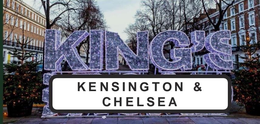
KENSINGTON & CHELSEA